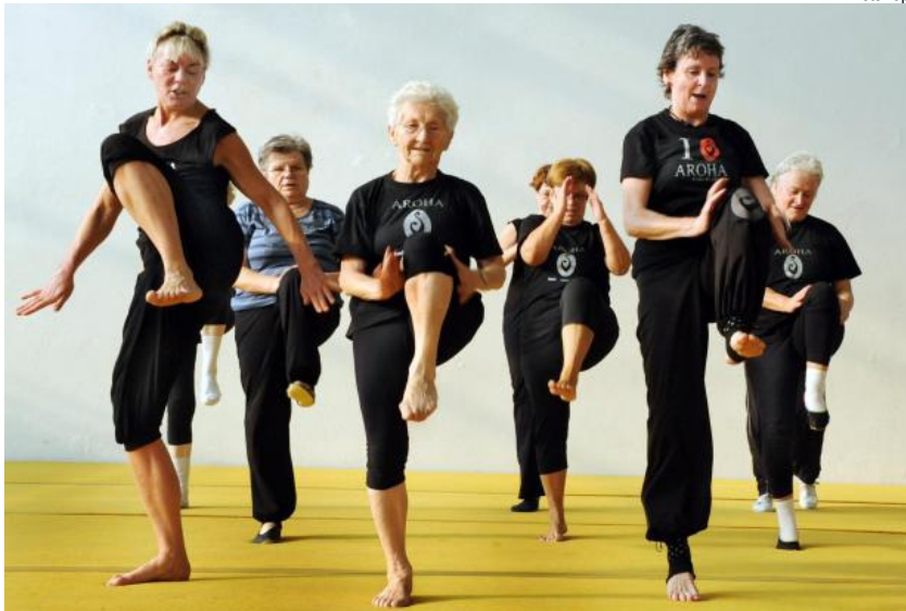
Die Deutschen werden so alt wie nie zuvor – und viele halten sich selbst im hohen Alter erstaunlich fit

Die Deutschen werden nicht nur immer älter, auch ihre geistige Leistungsfähigkeit bleibt im Alter länger erhalten als noch vor 20 Jahren. Das ist das erfreuliche Ergebnis einer gemeinsamen Studie mehrerer Berliner Forschungseinrichtungen, das in der Fachzeitschrift "Psychology and Aging" veröffentlicht wird. Beteiligt waren Wissenschaftler der Humboldt-Universität , der Charité , des Max-Planck-Instituts für Bildungsforschung sowie das Sozio-oekonomische Panel ( SOEP ).