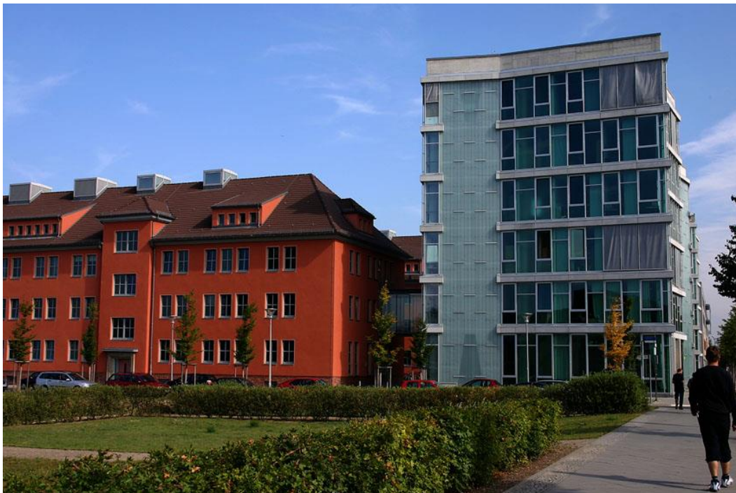
Institut für Psychologie, Wolfgang Köhler-Haus

Auf den folgenden Seiten finden Sie wichtige Informationen, die Ihnen den Einstieg an der Universität erleichtern sollen.